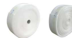
Épaisseur 8 mm Hauteurs 150 et 200 mm