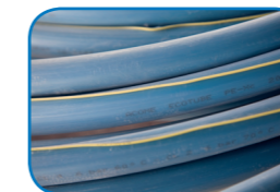
Couronnes de 240 m